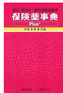
保険薬事典プラス 令和5年8月版