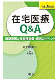
在宅医療Q&A令和5年版