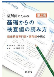
薬剤師のための基礎からの 検査値の読み方 第2版