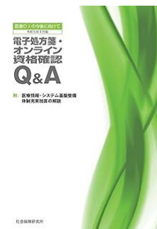
医療DXの今後に向けて 電子処方箋・オンライン資格確認Q&A