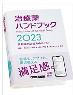
治療薬ハンドブック2023