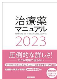
治療薬マニュアル2023