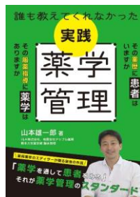
誰も教えてくれなかった実践薬学管理