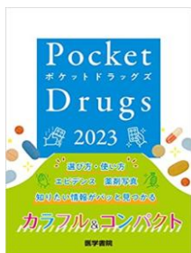
Pocket Drugs 2023