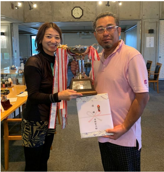
会長から優勝カップと副賞の贈呈