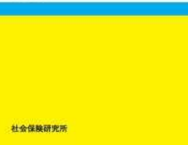
ジェネリック医薬品リスト 令和4年8月版