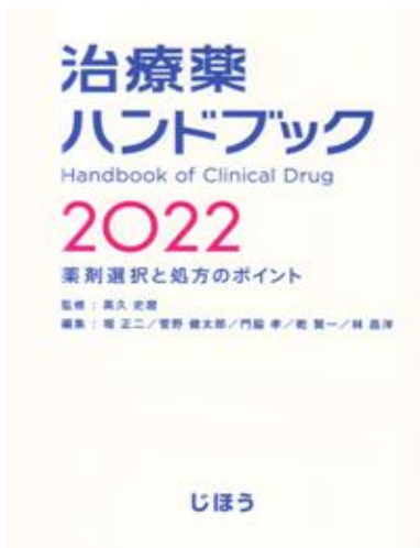
治療薬ハンドブック 2022