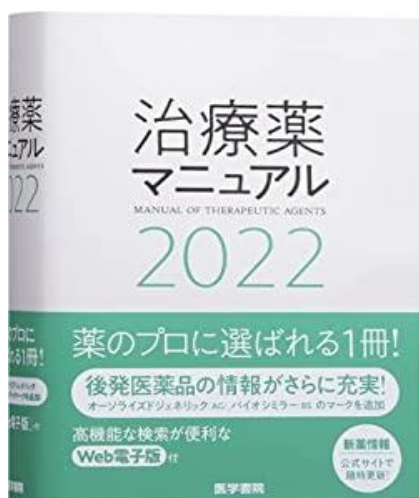
治療薬マニュアル 2022