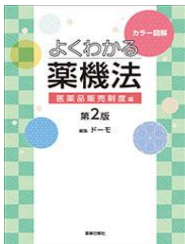
カラー図解 よくわかる薬機法 医薬品販売制度編 第2版